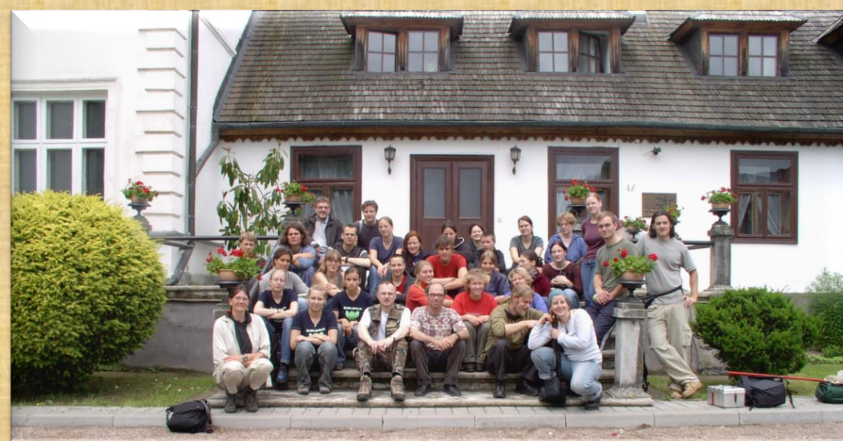
Polsko-niemiecki obóz naukowy w dolinie Narwi, Drozdowo

Zorganizowano obozy naukowe: w Drozdowie (2003 i 2004), Ełku (2003), Jeleń (2004), Bory Tucholskie (2004) oraz opublikowano 17 artykułów naukowych.