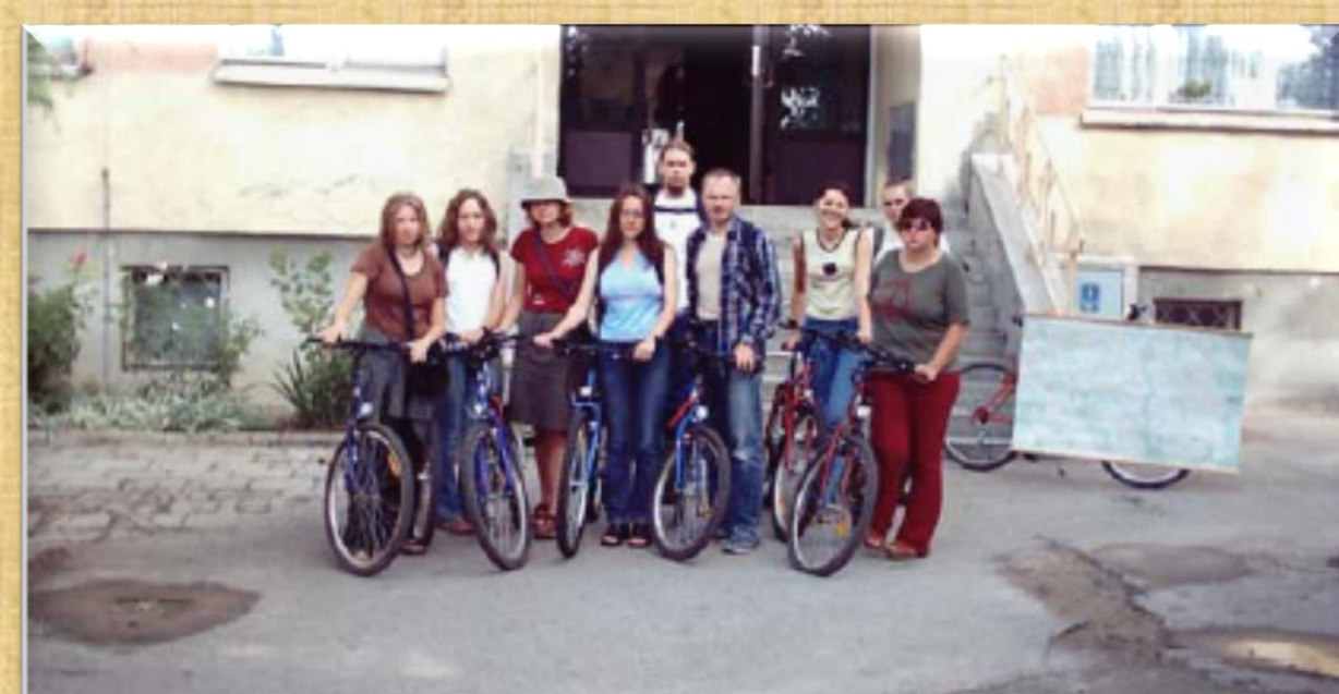
Obóz naukowy w Elku, 2003